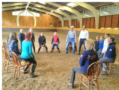
Fysio oefeningen bij zitcompetities